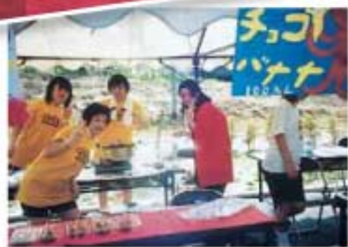
▲第1回 総合南東北福祉センターまつり