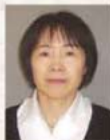
総合南東北福祉センター 高齢部門