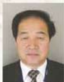
社会福祉法人 南東北福祉事業団