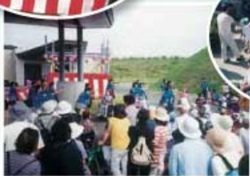
▲福祉センター夏まつりの様子