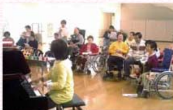
「ひまわりコンサート」の様子

毎週木曜日の「ボランティア紙ふうせん ひまわりコンサート」も3年目に入り、私達も毎週楽しみにしております。そして、利用者様からもエネルギーを頂いています。これからも、みなさんとふれあいながら楽しい時をすごして行きたいと思います。