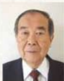
社会福祉法人 南東北福祉事業団 総合南東北福祉センター

今後とも、役職員が一丸となり自己責任の元、尚一層の福祉サービスの向上と充実した施設運営の実現に取り組みますので、旧に倍してのご指導ご支援を賜りますようお願い申し上げます。