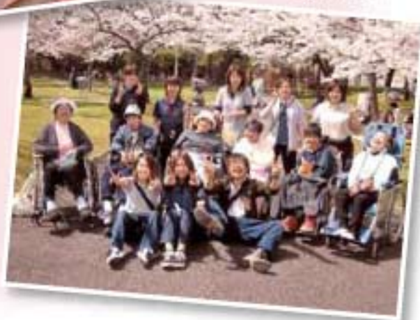
▼満開の桜の木の下で…