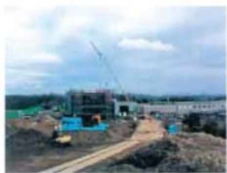
▲建設中のホワイトハウス