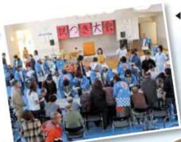
◀合同もちつき大会