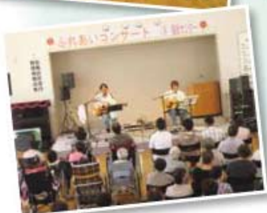
▲「あほうどり」によるコンサート