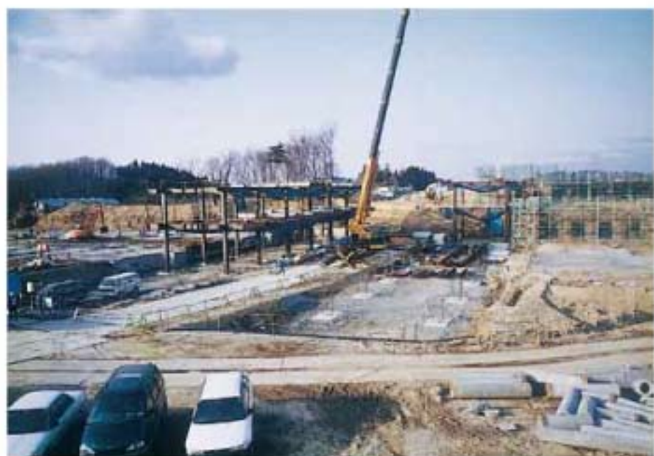
▲建設中の総合南東北福祉センター