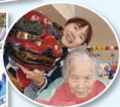
▲新年祝賀会では獅子舞が登場!