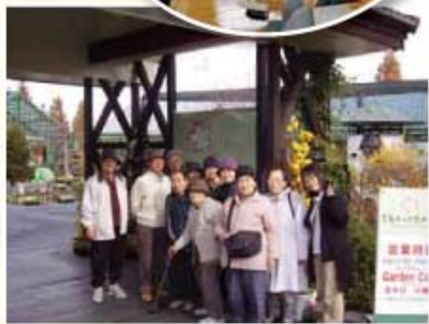
▶三春ハーブガーデンへ