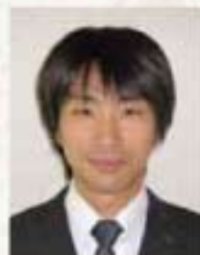
総合南東北福祉センター 障害部門

節目の年にあたり、初心に戻り『利用者さんのために』『地域に根ざした施設』『安心して利用できる施設』を目指して、より一層質の高いサービスの提供を目指して参りたいと思います。今後ともご指導ご鞭撻の程よろしくお願い申し上げます。