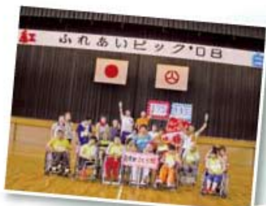
◀ふれあいピックに参加しました