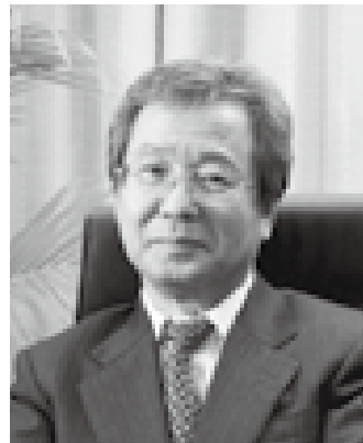
社会福祉法人 南東北福祉事業団 理事長