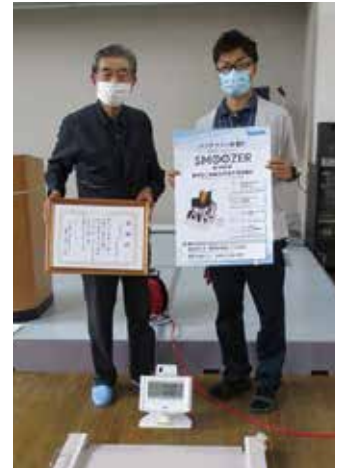
社会福祉法人 南東北福祉事業団 総合南東北福祉センター 事務担当