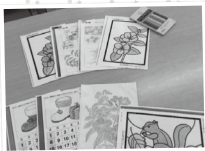
できあがった塗り絵です！