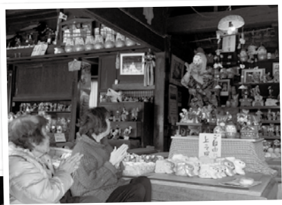
手拍子しながらひよっこ踊り鑑賞