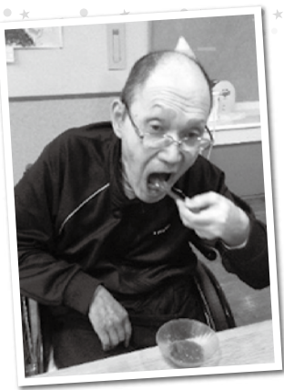
あんこの甘さと抹茶の苦みが絶妙