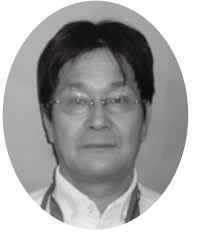
社会福祉法人 南東北福祉事業団 常務理事