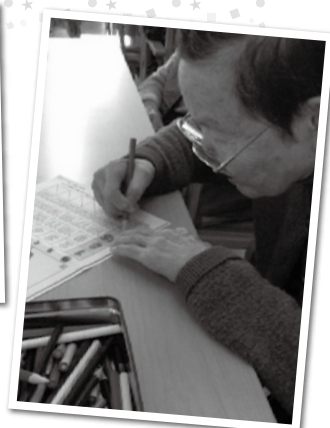
集中して塗っています！