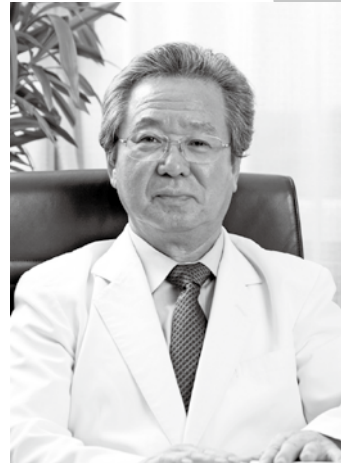
社会福祉法人 南東北福祉事業団 理事長