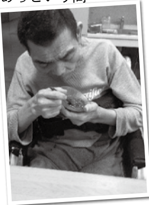
食べるのはあつという間