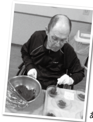
あんこをトッピング