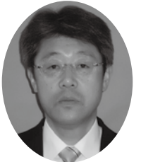
社会福祉法人 南東北福祉事業団 法人本部管理局长

南東北福祉事業団は、昨年4月に東京都世田谷区に、南東北グループの本体である一般財団法人脳神経疾患研究所と一体となって『東京リハビリテーションセンター世田谷』をオープンさせました。まだまだ、何かと不足している部分を充実させていかなければならない状況ではありますが、昨年の流行語にならって「One Team (ワンチーム)」で取り組んでまいります。また、昨年の漢字一文字は新年号にちなみだ「令」でしたが、当法人も成人式(設立20年)が終わり、新たな1年(21年目)を迎えます。「利用者さん中心」に、そして職員も大切にしながら頑張っていく所存でありますので、皆様のご指導・ご支援をよろしくお願いいたします。