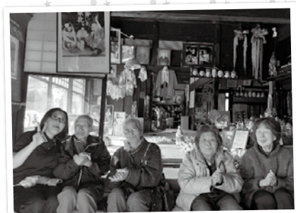
職員と一緒に記念撮影！

デコ屋敷に向かう車内では、「楽しみだわ」「久しぶりに行く。小さい頃に行った事があるんだ」と会話を弾ませていました。デコ屋敷につくと、ひよっこ踊りの名人がお出迎え。間近でみるひよっこ踊りに、利用者さんも大喜びで、手拍子をしながらかしそうに過ごしていました。また、ご主人から皆さんに、素敵な絵のプレゼントもありました。販売品の人型や干支の形の張子を見たり、実際にお面をつけたりして、とても充実したドライブツアーになりました。 帰りの車内では、「本当によかった」「楽しかった」と大満足の様子でした。