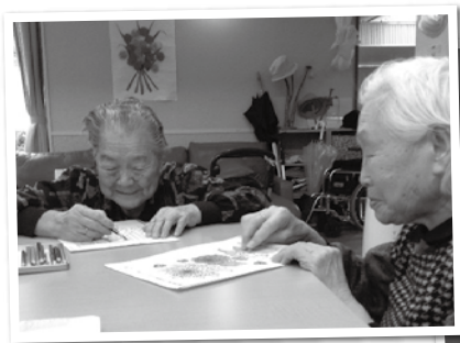
楽しくおしゃべりしながら！

作品は郡山市の高齢者作品展に出品して、12月13日(金)～15日(日)まで展示されました。