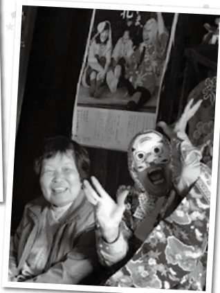
ひよっこ踊りの名人のご主人とハイ！チーズ！