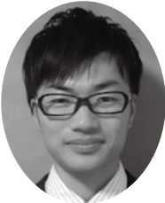
障がい者支援施設 南東北さくら館 施設長

昨年を振り返りますと、全国各地で大きな災害に見舞われ、特に福島県内においても台風とそれ