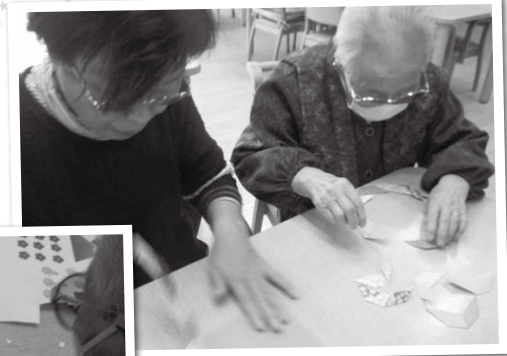
綺麗にできるかしら