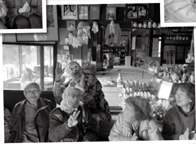
デコ屋敷楽しかったです。