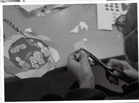
完成まであと少し！